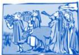
Inzameling van de oogst

Tijdens de woestijnreis werd het volk gevoed door het manna, het ongezuurde brood uit de hemel. In het beloofde land moest men dit feest vieren, Joz. 5:10-12. De priester moest een schoof van de eerstelingen van het land, tarwe en gerst, bewegen voor het aangezicht van God, op de dag na de sabbath. Men kon pas eten