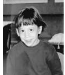
Een jongetje van de dovenschool

De directeur, een religieuze Jood, heeft het grootste deel van zijn leven gegeven aan de opvoeding van deze dove kinderen. Door de jaren heen hebben we met hem een relatie van warme vriendschap opgebouwd en zijn getuige geweest van zijn liefde en zijn harde werken voor deze school.