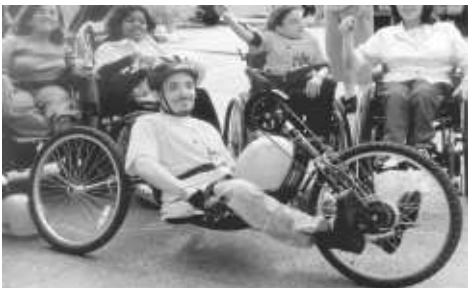
Een gehandicapte jongere uit het Alyn Hospitaal neemt ook deel aan de race met een speciale driewieler.

Wij hebben een bezoek gebracht aan Beit Galgalim en waren diep onder de indruk van de liefdevolle zorg en de kwaliteit, waarmee men dit werk aanbiedt. Toen ons gevraagd werd hen te helpen bij het opzetten van een nieuwe workshop voor kunst, waren wij blij hier gehoor aan te kunnen geven. Een van de ouders vertelde ons hoe geweldig dit was voor hen en hun kind.