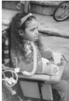
Een meisje uit het Alyn Hospitaal

In Jeruzalem is het ALYN Hospitaal het enige orthopedisch en rehabilitatie centrum in Israël voor lichamelijk gehandicapte kinderen en volwassenen. Velen lijden aan een trauma vanwege ongelukken of terreur aanslagen. Zij hebben vaak vele dagen, weken, maanden of zelfs jaren nodig om hiervan te herstellen. Maar gelukkig zijn er ook bijzondere succesverhalen.