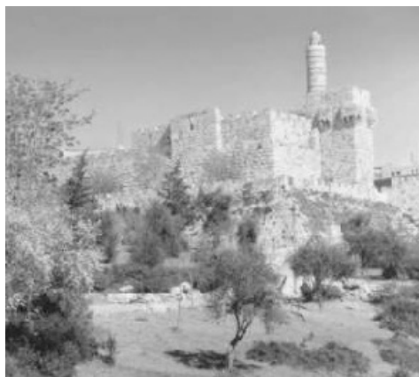
De Citadel van David te Jeruzalem

Het was nodig voor David om te weten wat Israël moest doen. Vandaag moet Israël ook de juiste tijden kennen om te weten wat ze moet doen. De naties hebben allerlei en veel meningen over de rol die Israël zou moeten spelen om maar vrede te hebben met de Arabische burens.