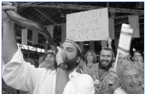
Een Israëliëse man blaast de Sjofar ter verwelkoming van bijna 400 Amerikaanse joden bij hun aankomst op Ben Gurion Airport op 9 juli jl.

Terwijl de herhaalde aanslagen van terrorisme de Israëliërs hebben beroofd van hun gevoel van veiligheid, heeft de nationale economie enorme verliezen geleden en de werkloosheid is omhoog gevlogen en bedraagt meer dan 10% van de werkende bevolking. Veel Israëliërs hebben een baan en hun heil gezocht