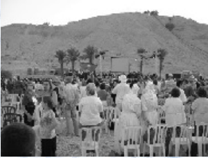
Foto-impresie Loofhuttenfeest 2002

Het feest begon in Ein Gedi met een maaltijd in de woestijn gevolgd door een avond met lofprijs en aanbidding.