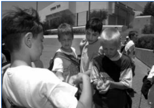
Kinderen van Russische emigranten families genieten van hun zomerkamp in de gemeenschap van Ariel, in het midden van Samaria.

Palestijnse leiders geloven oprecht dat de tijd voor hen werkt en dat een Arabische meerderheid 'onvermijdelijk' is. Maar zet aan tot nog meer moeilijkheden in het land en je verjaagt zowel de potentiële nieuwkomers als de doorgewinterde Israëliëse burgers, om zo de demografische verschuiving te bespoedigen.