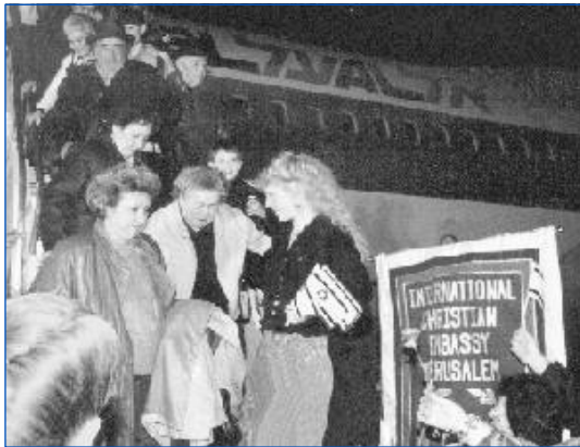
In mei 1990 verwelkomde de ICAJ staf de eerste van 51 vluchten met Sovjet Joden, die zij had gesponsord.

De ICAJ gaat voort om intensief betrokken te zijn bij de pogingen in heel Oost Europa, de uitgestrekte Russische republiek, Centraal Azië en nu Argentinië, om Joden op te sporen en bij te staan die geïnteresseerd zijn om naar Israël te immigreren. Dit is een profetische roeping om in onze dagen verbonden te zijn met de zaak van de Vader, terwijl Hij zijn wonderbare beloften vervult door het volk terug te brengen dat Hij bijna 2000 jaar geleden