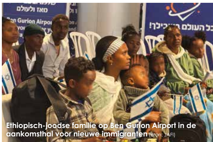
Ethiopisch-joodse familie op Ben Gurion Airport in de aankomsthal voor nieuwe immigranten

Tussen januari en september van dit jaar zijn dankzij de ICEJ 115 Ethiopische olim (nieuwkomers) in Israël aangekomen. De meerderheid, een groep van 74 individuen, vestigde zich in het absorptiecentrum Beit Alpha, terwijl kleinere groepen hun eerste thuis in Israël vonden in centra in Be'er Sheva en Ashkelon.