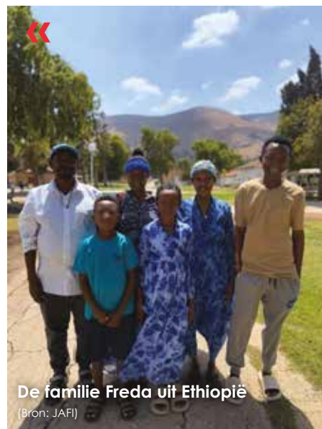
De familie Freda uit Ethiopië

Met uw hulp kijken we ernaar uit om dit heilige werk voort te zetten, terwijl we samen meer Joden in Israël verwelkomen – uit Ethiopië en vanuit heel de wereld. 🌍