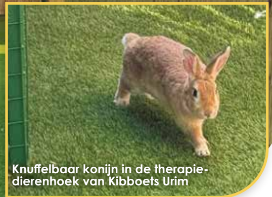
Knuffelbaar konijn in de therapie- dierenhoek van Kibboets Urim

In kibboets Urim, op slechts een paar kilometer van Gaza, hebben een therapiepaardenboerderij en een dierenhoek kinderen en volwassenen uit de hele regio geholpen om het trauma van jarenlange onophoudelijke raketbeschietingen te verwerken. Maar de terreurinvasie van 7 oktober dwong de gemeenschap te evacueren en de ranch te sluiten, zelfs in een tijd waarin het aantal Israëliëse kinderen en volwassenen dat traumazorg nodig had exponentieel toenam.