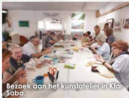
Bezoek aan het kunstatelier in Kfar Saba.